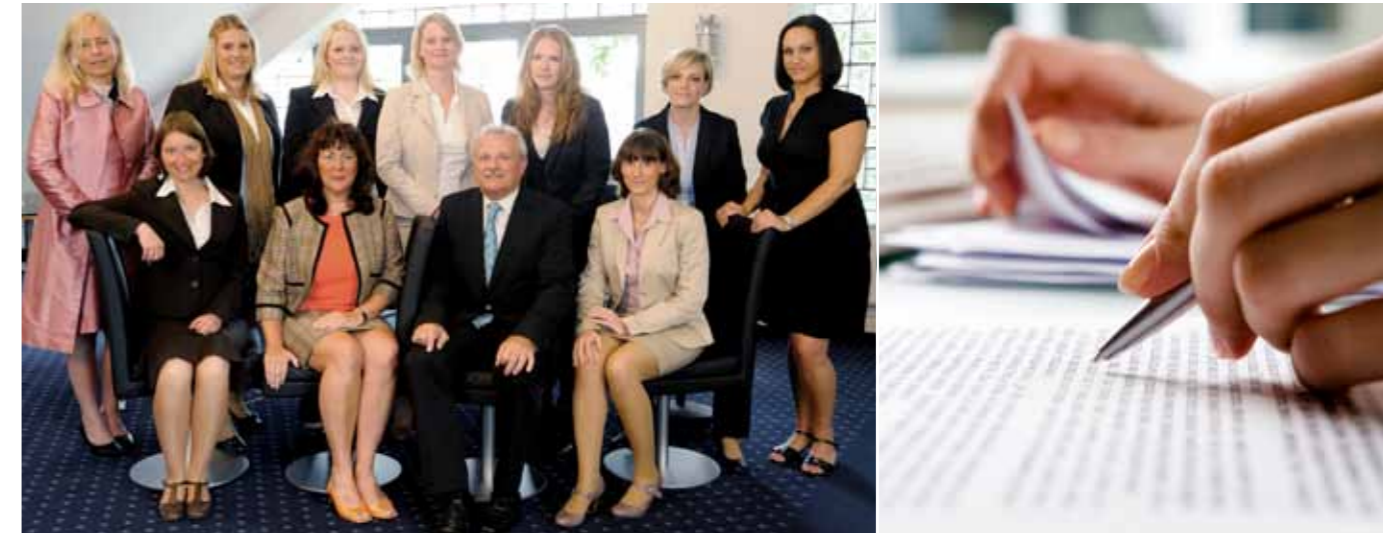
Das Basisteam der Rendita Colonia The team of Rendita Colonia

Herzlich willkommen bei der Rendita Colonia, dem Spezialisten für zielgerichtete und nachhaltige Entwicklung und Betreuung von Gewerbeimmobilien. Unser Team ist effizient strukturiert, verfügt über ein ausgeprägtes Know-how in Bezug auf Planung, Betreuung, Steuerung, Vermietung und Verwaltung von Gewerbeimmobilien sowie über 15 Jahre Erfahrung. Dies bildet den Schlüssel für die positive Wertentwicklung Ihrer Immobilie.