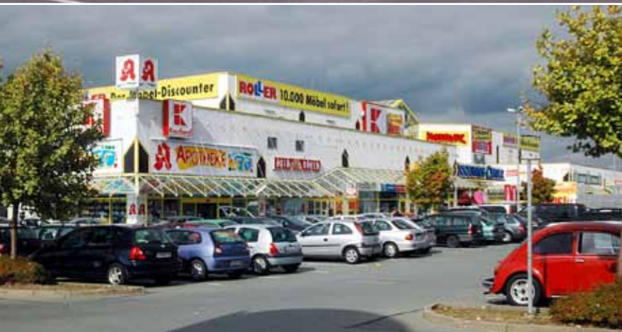
„Erzgebirgscenter“ in Annaberg-Buchholz „Erzgebirgscenter“ in Annaberg-Buchholz