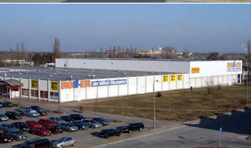
Fachmarktzentrum in Eisenhüttenstadt Retail park in Eisenhüttenstadt