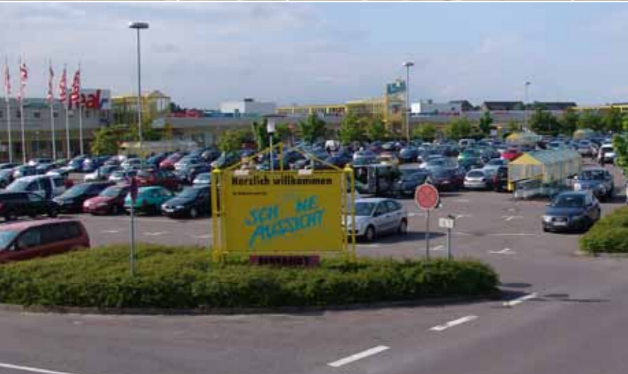
„Schöne Aussicht“ in Leißling „Schöne Aussicht“ in Leißling