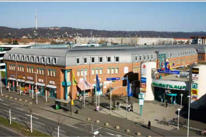
„Seidnitz-Center“ in Dresden „Seidnitz-Center“ in Dresden