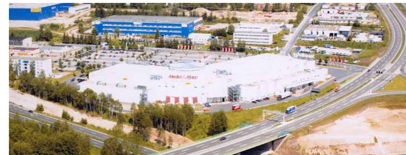
Fachmarktzentrum A71 in Zella-Mehlis Retail park A71 in Zella-Mehlis

Each location has its individual characteristics and specific considerations. These factors must be taken in account in order to create a sustainable development.